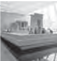
Temple de Dendur