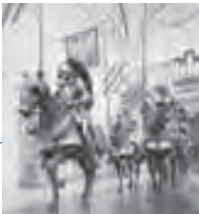
Cour d'armures équestres