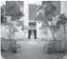
Atrium de l'aile Lehman