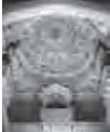
Plafond de la salle de réunion «Jaine»