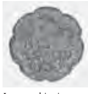
Laques chinoises (3 e étage)

Prière de ne pas toucher les œuvres d'art