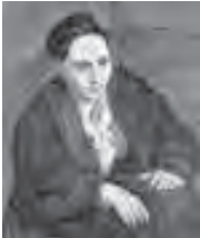
Picasso, Portrait de Gertrude Stein