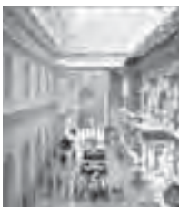
Cour de sculpture européenne