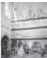
Clôture de chœur