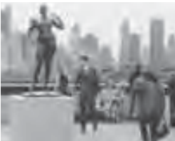
Terrasse-jardin sur le toit