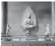
Autel bouddhique japonais