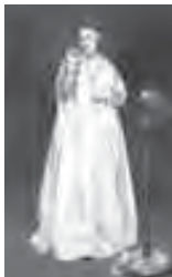
Manet, «Une jeune dame en 1866»