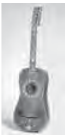
Guitare baroque espagnole