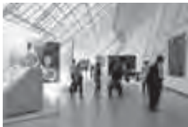
Salles d'art moderne (mezzanine)