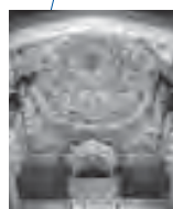
ジャイナ教集会堂の天井