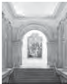
ティエポロギャラリー、