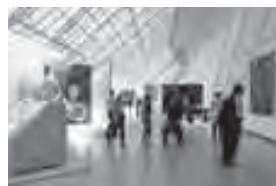
近代美術展示室（中2階）