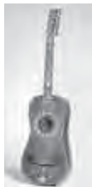
スペインのパロック様式ギター