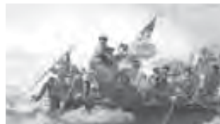
ロイツェ「デラウェア川を渡るワシントン」